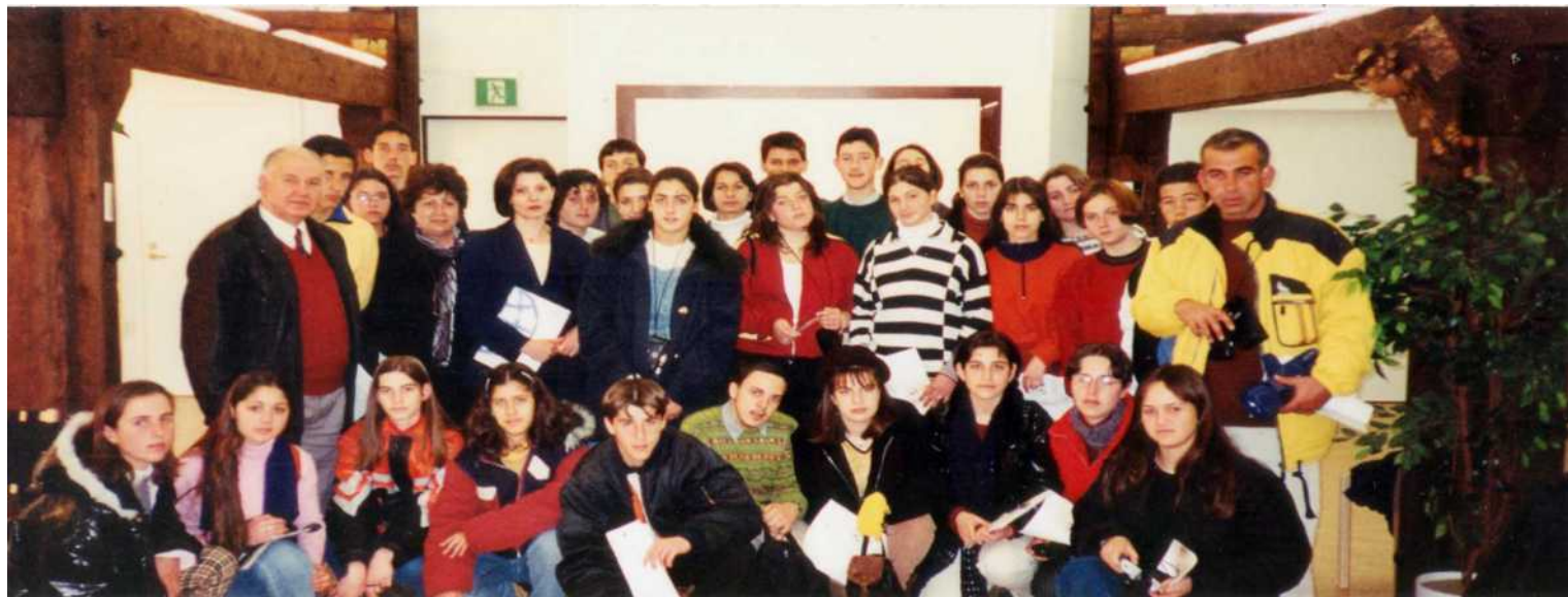
Στο μουσείο Micola της Βάασα.

πολυμέσων με σύνδεση στο INTERNET, overhead projector και συσκευή για slides. Επίσης κάθε σχολείο έχει τη δική του βιβλιοθήκη και, υπολογιστές συνδεδεμένους με το δίκτυο INTERNET.